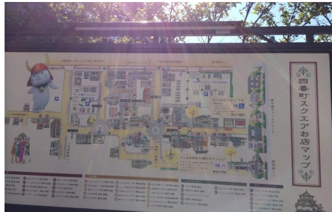
図4 四番街スクエアのマップ