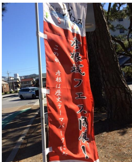
図 6 堀を囲むように立てられていたフェスティバルののぼり

住民は、観光客が多く訪れることでまちが発展することや経済的な潤いがもたらされることを望んでいる。しかし同時に、歴史的な景観の保存や保全にも努力する必要があることを理解している。それを受けて行政は今年の秋、市全体でイベントをより多く盛大におこなうことを企画した。筆者が調査で彦根を訪れた際にまず目に入ってきたのが、「この秋、彦根は歴史テーマパークになる」というのぼりであった（図 6）。一般的に歴史的な文化財が現存している地域では、それを生かしてまちづくりをおこなうものだが、特定の年代を再現した時代村のようなテーマパークを造ることに抵抗感を持つ傾向がある。彦根では市が企画したこの歴史テーマパーク化に反対する住民はいなかったのか、もしくは市の意見がトップダウン式に通ってしまうほどの影響力であるのか、このことについて市の職員に聞いてみた。職員は「のぼりにあったような歴史テーマパークというのは、今年だけおこなうもので、城サミットとして開催したイベントのひとつです。甲冑祭としているいろいろな甲冑を着てみる機会を作ったり、様々なシンポジウムを開催したりするものなので、この先何年も工事をして建物を増築して歴史遊園地のようにするという意味のテーマパークではないです。確かにまちづくりに関してはわれわれが中心となっていることが多いですが、民間団体や観光連盟の方の協力もいただきながらやっています。本物を本物としてそのまま見てもらいたいという思いがある反面、多くの方は観光が半日程度で終わってしまうのが現状です。長時間滞在や宿泊者を増やすために歩いて回ってもらえる範囲を広げていくことが課題です。」と話していた。これらのことから、彦根では市が中心となって様々なイベント企画や方向性を決定していることは違いないが、財政を潤す利益のみを追求するのではなく、住民の代表としての立場からまちづくりを担っているということが分かった。