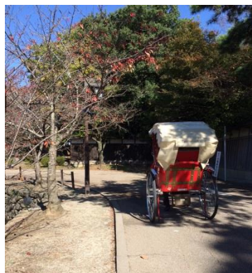
図5 彦根城周辺を巡る人力車

近江八幡は商人屋敷を見て回ることがメインとなることもあってか、家族連れや中高生の姿はほとんど見受けられなかった。車の管理状態に関しては少し先にも述べたが、彦根が最も駐車スペースを確保している。住民が利用する細い一般道路と、観光客が通る大きな道との違いが明確で、土地勘がない観光客にもわかりやすい構造となっている。長浜は市街地ということもあるせいか、大きな駐車スペースが1つある以外は周辺のコインパーキングを利用しているケースが目立った。その数も多くはないため道にはみ出て駐車している場合もあった。写真を撮ることが趣味である観光客にインタビューした際、「せっかく綺麗なまちなのにこういう車が止まっていると残念だし、写真が撮れない。」と話していたことから、車の管理については対応が急がれる点であろう。まちの静かさについて言えば、彦根と長浜はにぎやかな声が多く飛び交っていた。店員が店の外へ出て商品をアピールして客引きをおこない、彦根城周辺では人力車が何台も堀を巡っているといった様子である(図5)。