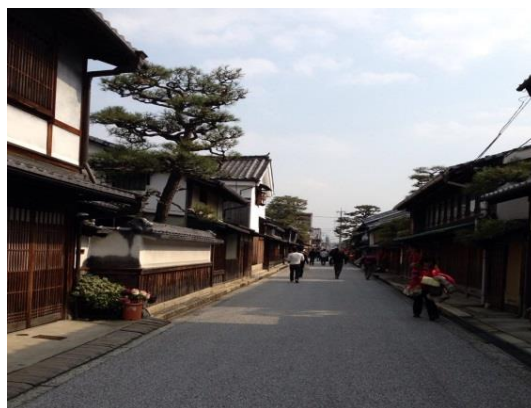
図 2 近江八幡の商人屋敷の風景

近江八幡のまちづくりにおいて最も重要であったことは、八幡堀の再生である。現在の八幡堀は映画のロケ地にも使われるほど綺麗に整備され、地域を代表する景観の 1 つとなっている。しかしこの堀は、高度経済成長期には運河としての価値はほぼなくなり、汚染が進み荒れていたことから、市民からは堀を埋め立てて、道路を整備しようとの話も出ていたほどであった。埋め立てるための申請をおこない、助成金を行政から受けることが決定した後に、この話に待ったをかけた人たちがいた。それが青年会議所のメンバーである。彼らは経済政策優先の開発に危機感を覚え、埋め立てではなく再生を呼びかけた。当初は荒廃した堀の再生に関心を持つ人は少なく、彼らが堀の清掃をしているところを遠目で見ている程度であったが、徐々にその活動に注目が集まり、多くの人々の参加によって堀の再生が達成された。このようなまちづくりの動きが口コミで広がり、近江八幡への来街者が増加した。まちの再生が観光へと結びついているこの地では、まちを「商品化」することを避けており、作為的な景観を造ることに反対である住民が多い。青年会議所のメンバーを中心におこなわれてきたまちづくりは、一時の流行に左右されることなく、近江八幡が持ちうる歴史と文化から必然的に見えてくる条件をいかしたスタイルなのである（図 2）。