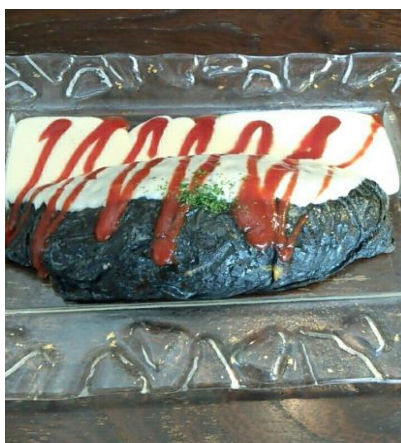
図3 黒壁スクエア名物の黒壁オムライス

また、多分野にわたるイベントや地元を代表する歴史を活用した祭りも開催されている。彦根では毎年城まつりが開催されており、近江牛を中心とした食へのアプローチも充実させている。キャッスルロード内の老舗の飲食店から、四番町スクエア内のレストランに至るまで、和洋中の様々な分野の飲食店がせめぎ合っている。近江八幡でも、まだ認知度は高いとは言えないが近江商人の暮らしぶりや地元の文化について歴史的な面から発信をしている。飲食店については表2にも示した通り小さな喫茶店が多い。装飾された大きな看板はなく、観光客をターゲットに展開しているというよりも住民が日ごろから利用するような、まちなかにたたずむ雰囲気がある。このようにソフトな面に関しては、観光客の満足度を左右する要因が多い。食事やイベントは地域らしさを色濃くかつハイクオリティに提供することが求められているのである。