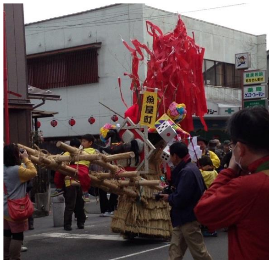
図 7 左義長祭りの様子

最後に近江八幡であるが、先にも述べてきたように、このまちの観光資源は現存する近江商人の屋敷群と江戸時代の情緒を思わせる水堀といった物理的なもの以外に、現代まで受け継がれている住民の生活それ自体が何よりも観光資源である。案内人の男性は、「ここは観光客を中心にしたまちづくりをするつもりはない。近江八幡の課題は年々深刻化している高齢化の問題のほうだ。この地に住んでもらえる若い人材が必要だが、田舎ということもあるし大都市にもそれほど近くないことから、増えるどころかみんな出て行ってしまう。」と話し、高齢化がまちの最大の問題であるとしている。住民同士の関わりについて「近江八幡では、住民同士が関わってこの地の歴史を伝え合うために、年に 2 回大きな祭りを行っている。1 つは八幡祭り、もう 1 つが左義長祭り（図 7）。これは老若男女問わずに住民が参加する祭りで、観光客のために開催されるイベントではない。もちろん住民以外の人も見に来るが、その人たちのための特別な出店や催し物などは用意されていない。ここは住民が発信源となっていていろんな交流の場を作ろうという中心的な存在になっていて、行政には法律上の規則やルールをアドバイスしてもらおうという感じだ。」と熱弁した。インタビューの時に隣にいた案内人の女性も、大きく頷きながら話を聞いていた。つまり近江八幡のまちづくりは住民からの発信によって企画され、行政がサポートするというスタイルであると言える。